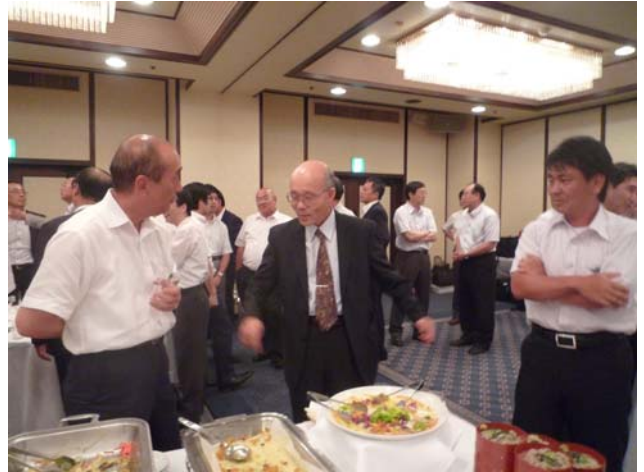
交流会での一コマ