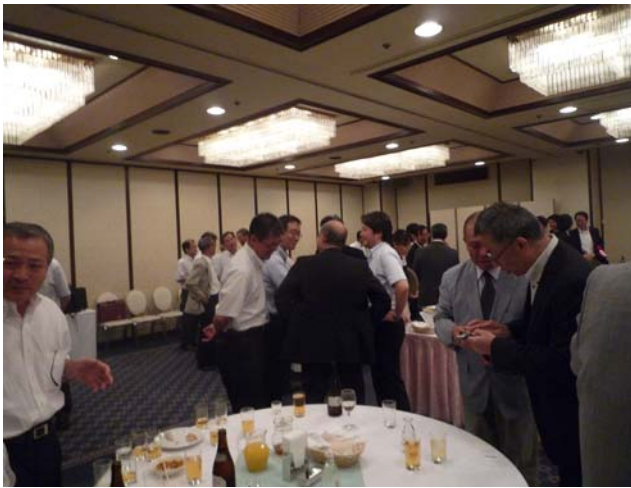
交流会での一コマ