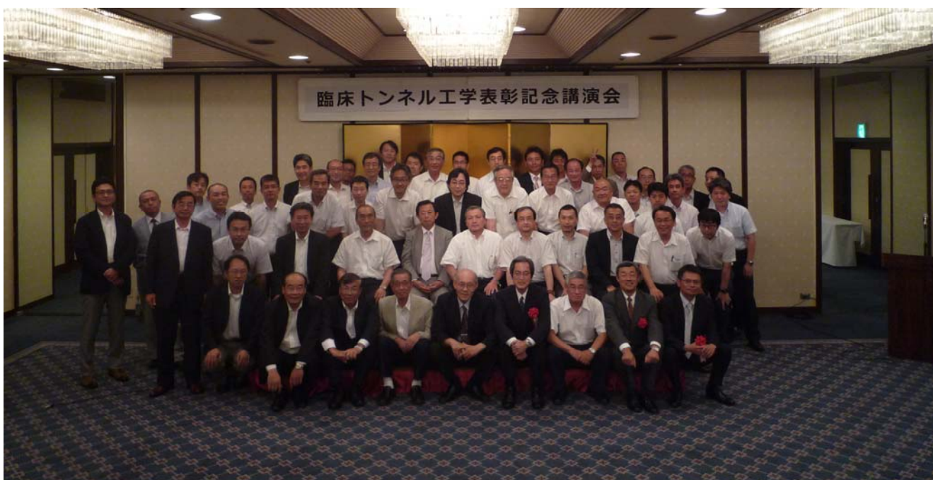
交流会終了後の記念撮影