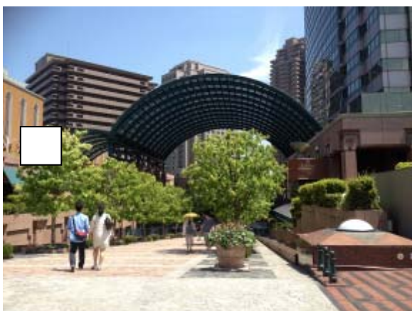
快晴に恵まれた恵比寿ガーデンプレイス