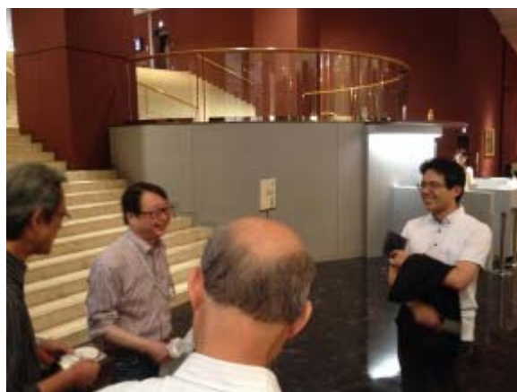
端田館長からのサプライズプレゼント