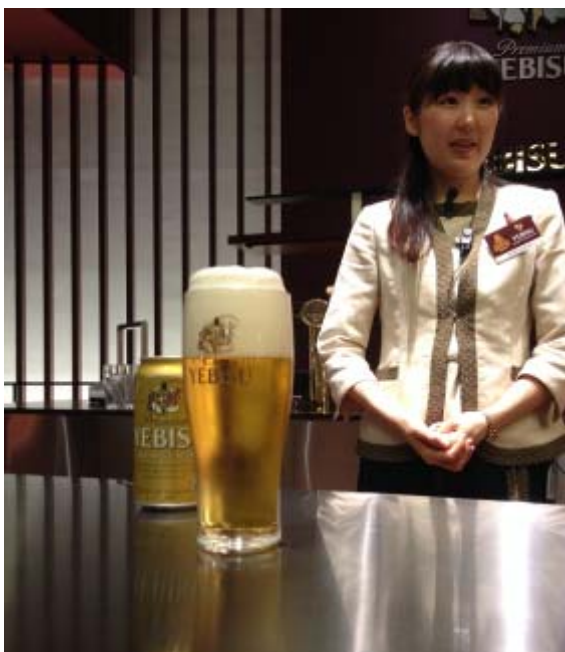
缶からもきれいに泡が立つ「三度注ぎ」