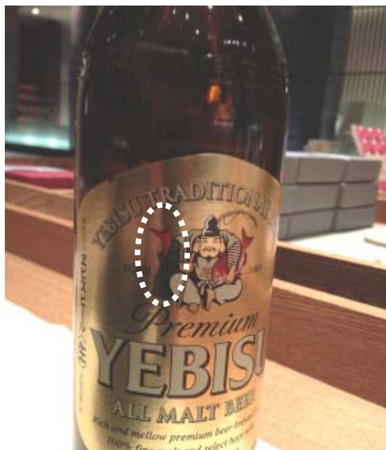
鯛が2尾のラッキーエビス(数百本に1本)