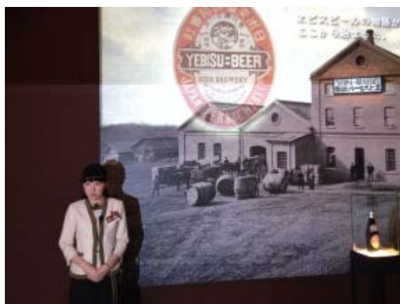
創業当時の風景（現在の恵比寿駅前）