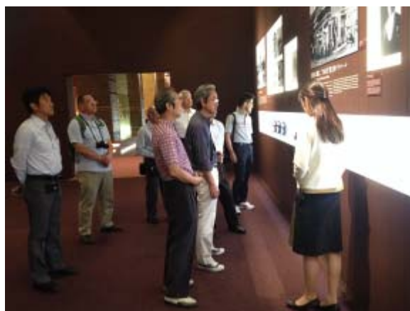
ブランドコミュニケーターによる説明