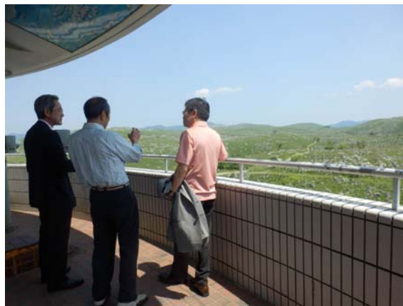
展望台での見学状況