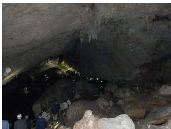
洞内での見学状況