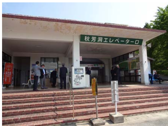
秋吉台案内所(エレベーター入口)