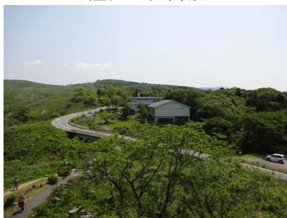
展望台からの風景(秋吉台科学博物館)