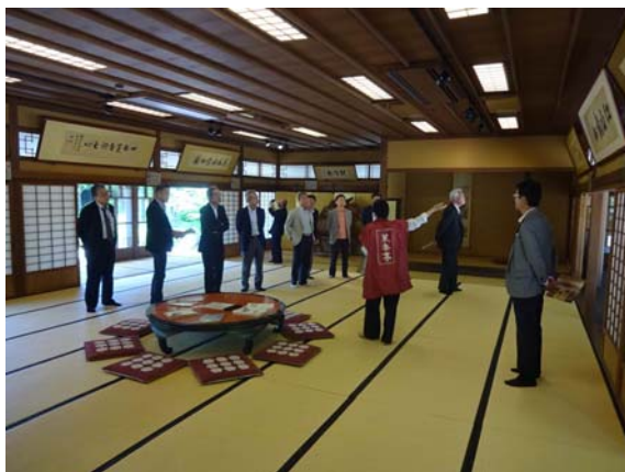
菜香亭内見学状況