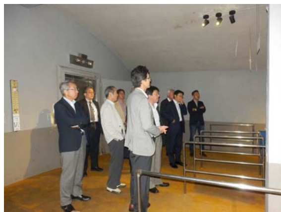
エレベーターを降りたところでの説明