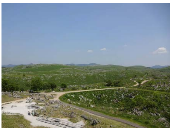
展望台からの風景(雄大なカルスト台地)