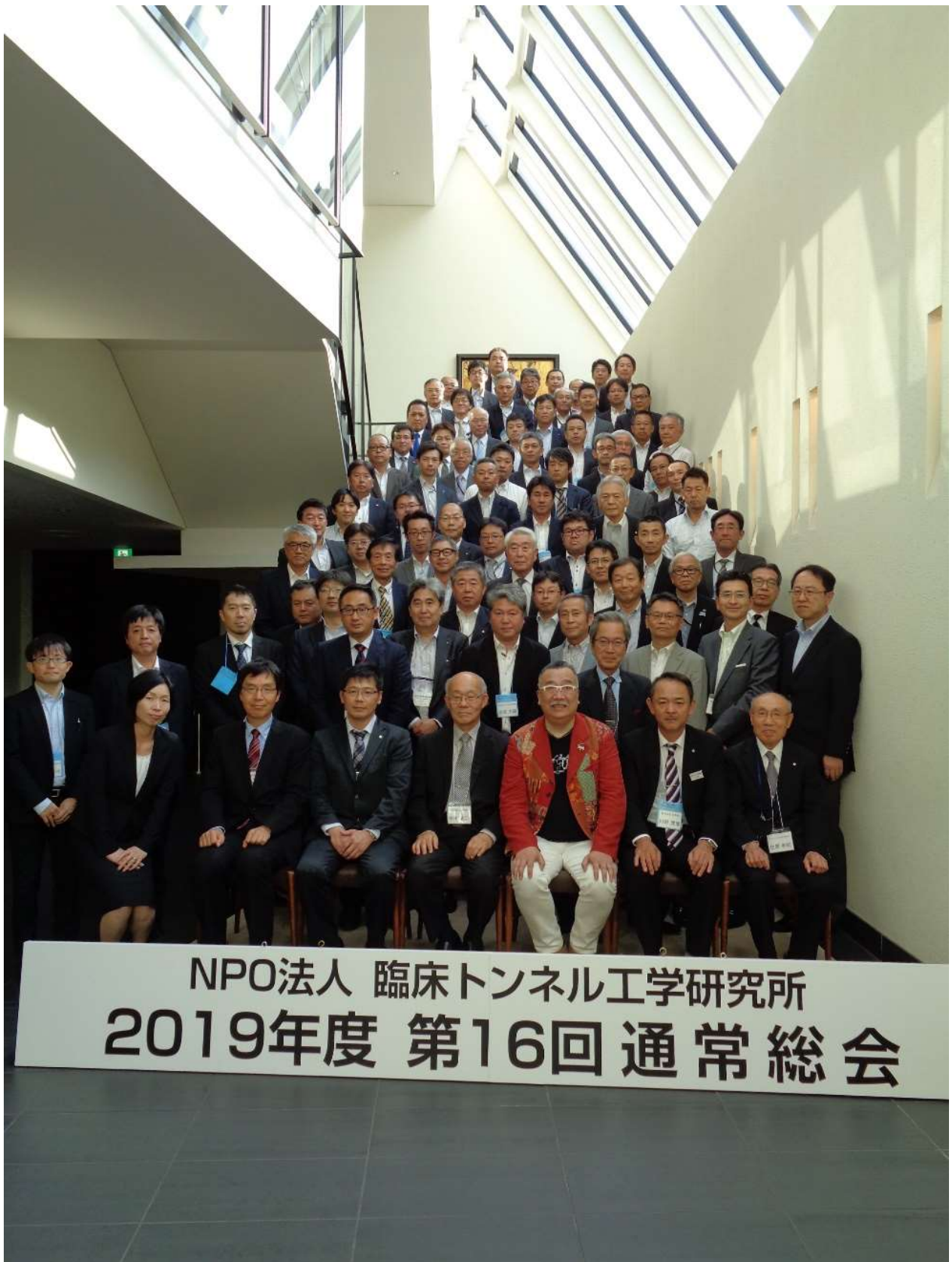
参加者の記念写真（於：北野クラブ ソラ）