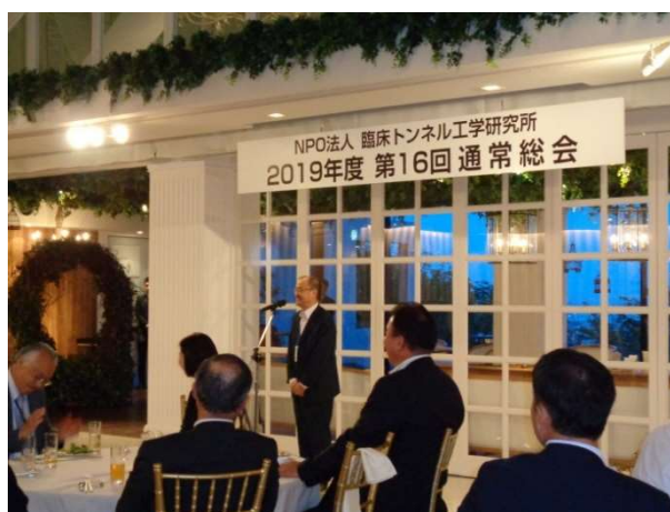
次回開催地支部の挨拶（福家四国支部長）