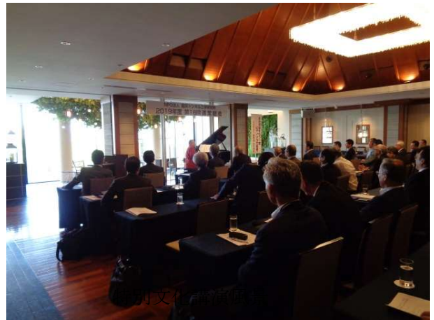
特別文化講演風景