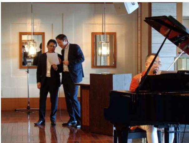
岡村幹事長と土永幹事のデュオ結成、新曲発表