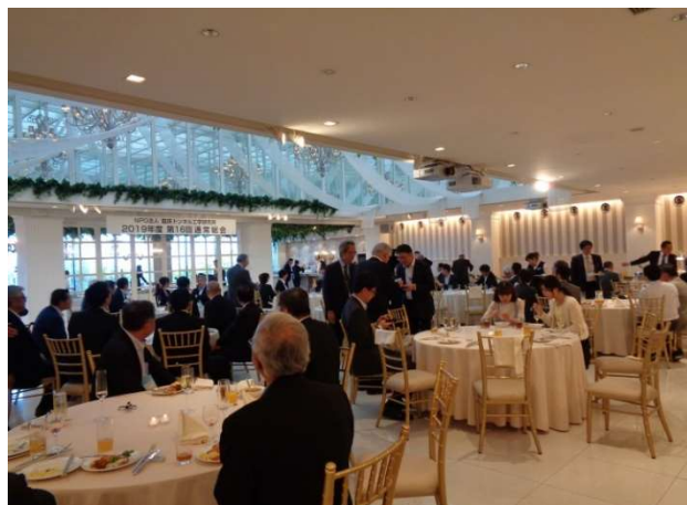
会員相互の交流と親睦そして名刺交換