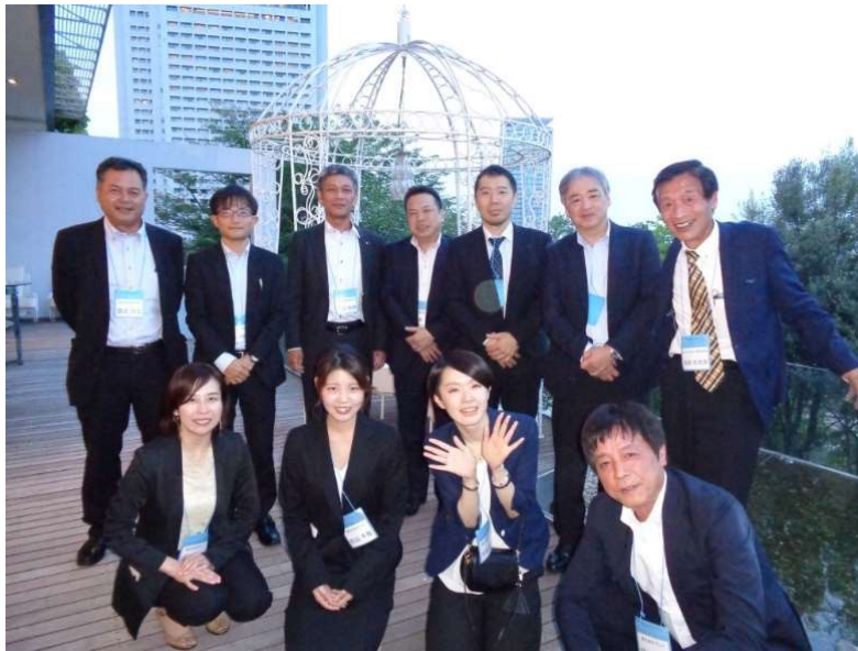
総会準備と総会受付にご協力頂きました近畿支部メンバー