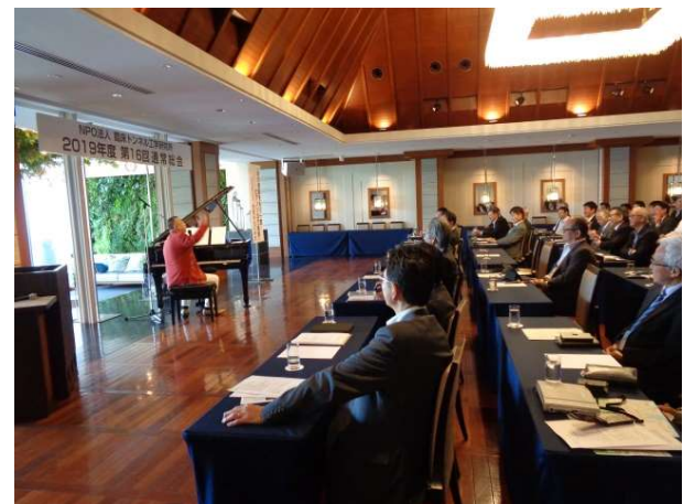
全員によるエーデルワイスの合唱♪