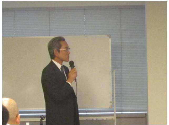
ついでに司会者です