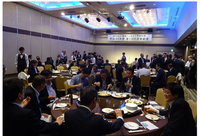
会員相互の交流と活発な意見交換