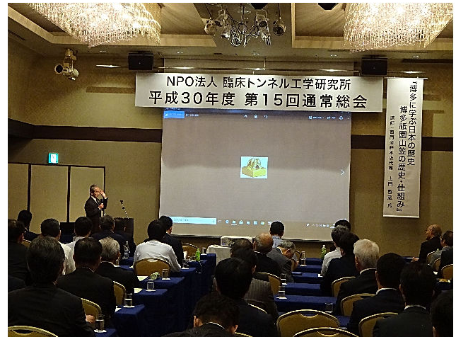
上田氏ご講演の様子

法被姿に着替えての登場、演出（6月1日から着用許可となる当番法被 博多では山笠の期間正装）内容が盛り沢山で時間的に厳しかった。