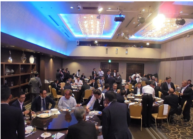
円卓を囲む多くの参加者