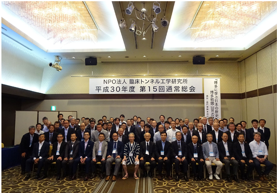
参加者の記念写真