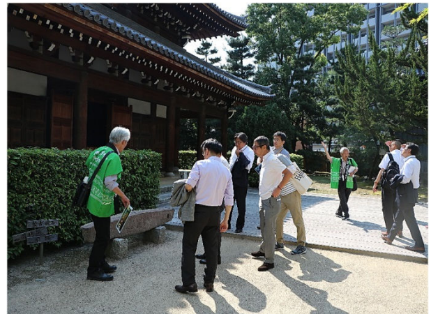
承天寺 見学の様子