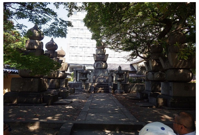
福岡藩 2 代目藩主 黒田忠之の墓