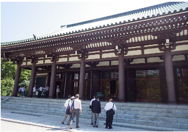
弘法大師が建立した東長寺 を見学