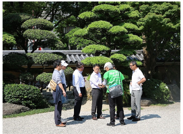
案内の方から東長寺の歴史を聞く