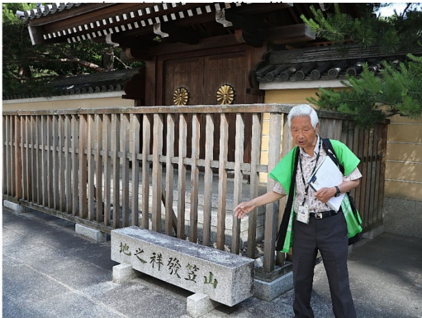
山笠発祥の碑を承天寺にて発見！！