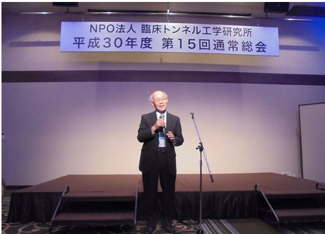
主催者（理事長）の挨拶