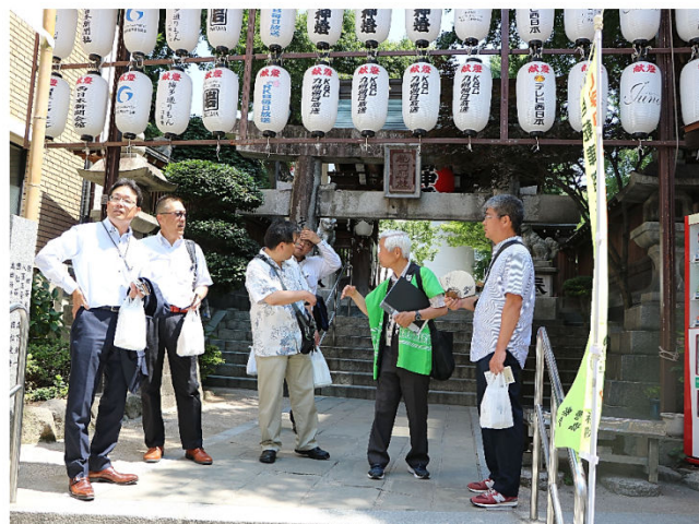
榎田神社を見学 天気☀にも恵まれ心地よく見学終了 のどの渇きと体力の限界???