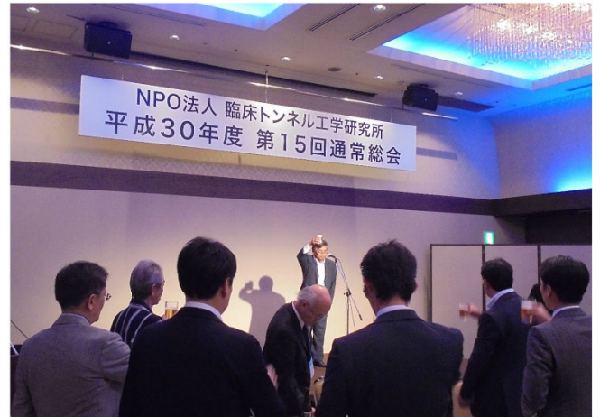
開催支部の挨拶（大和九州支部長）