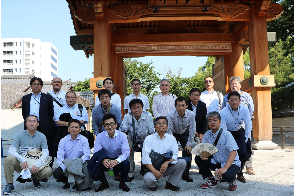
見学会 参加メンバー