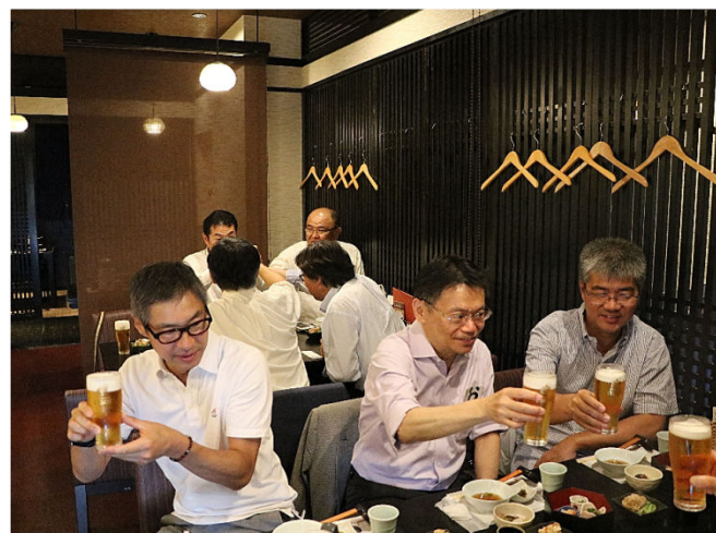
まち歩きの後 我慢して 昼間の一杯は最高でした (笑)。ちなみに、昼食メニューは水炊きセット