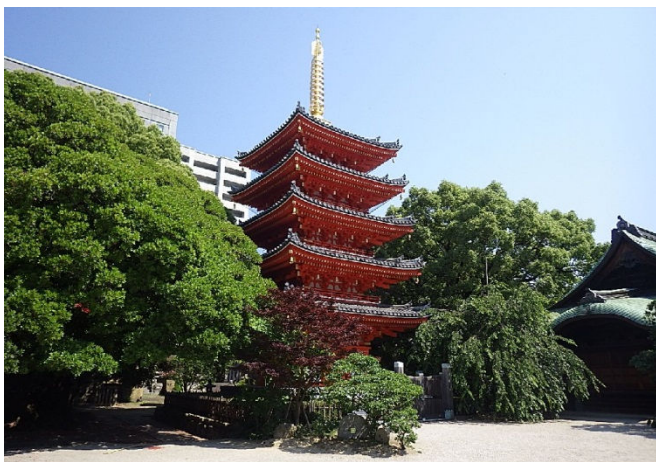
平成 23 年完成の東長寺の五重塔