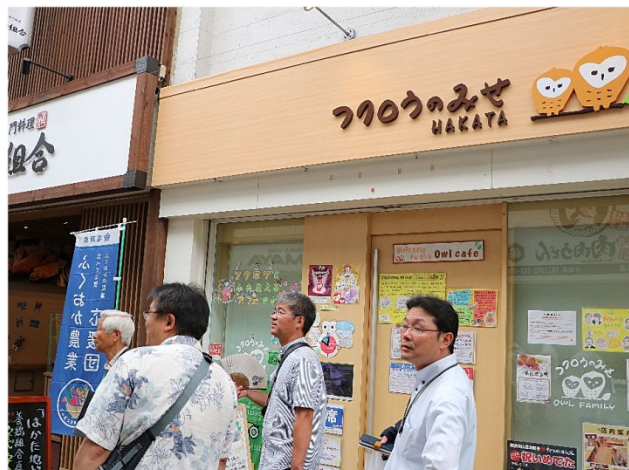
川端通りをまち歩き