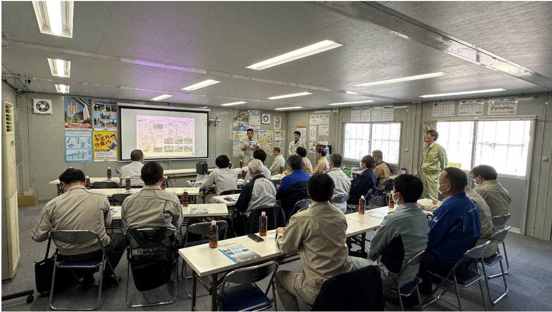
嘉屋所長による工事説明状況