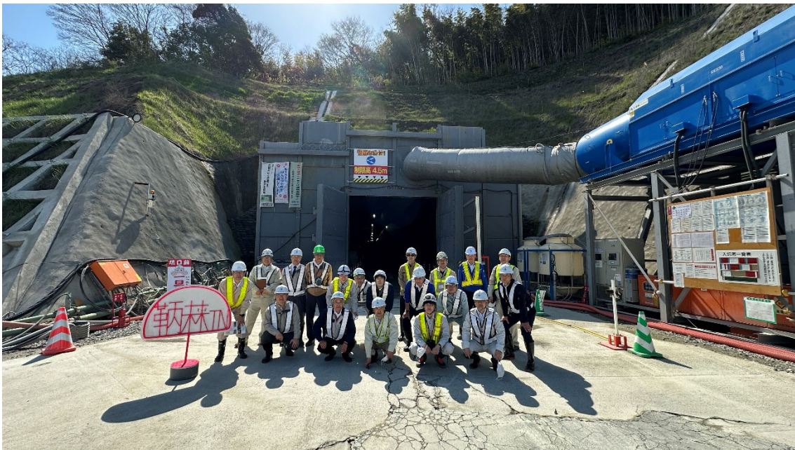
東坑口前にて集合写真撮影