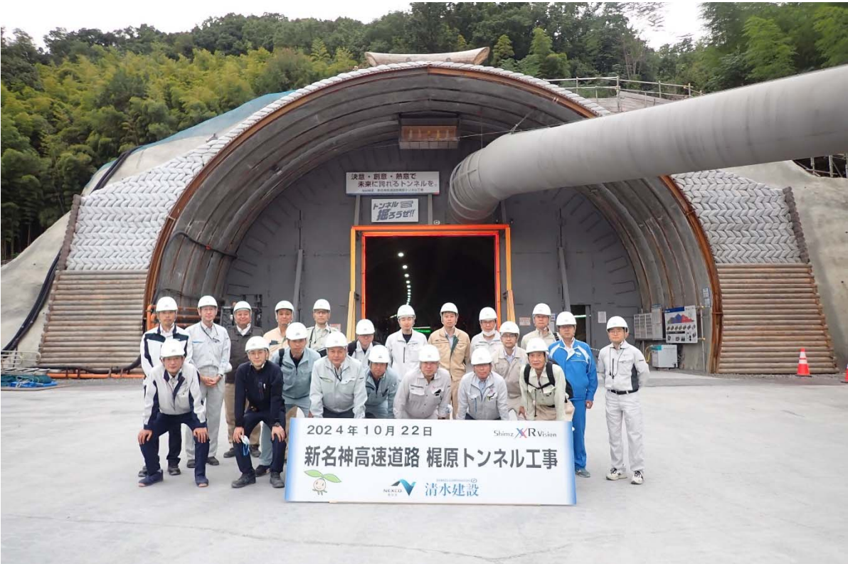
坑口前での見学会集合写真