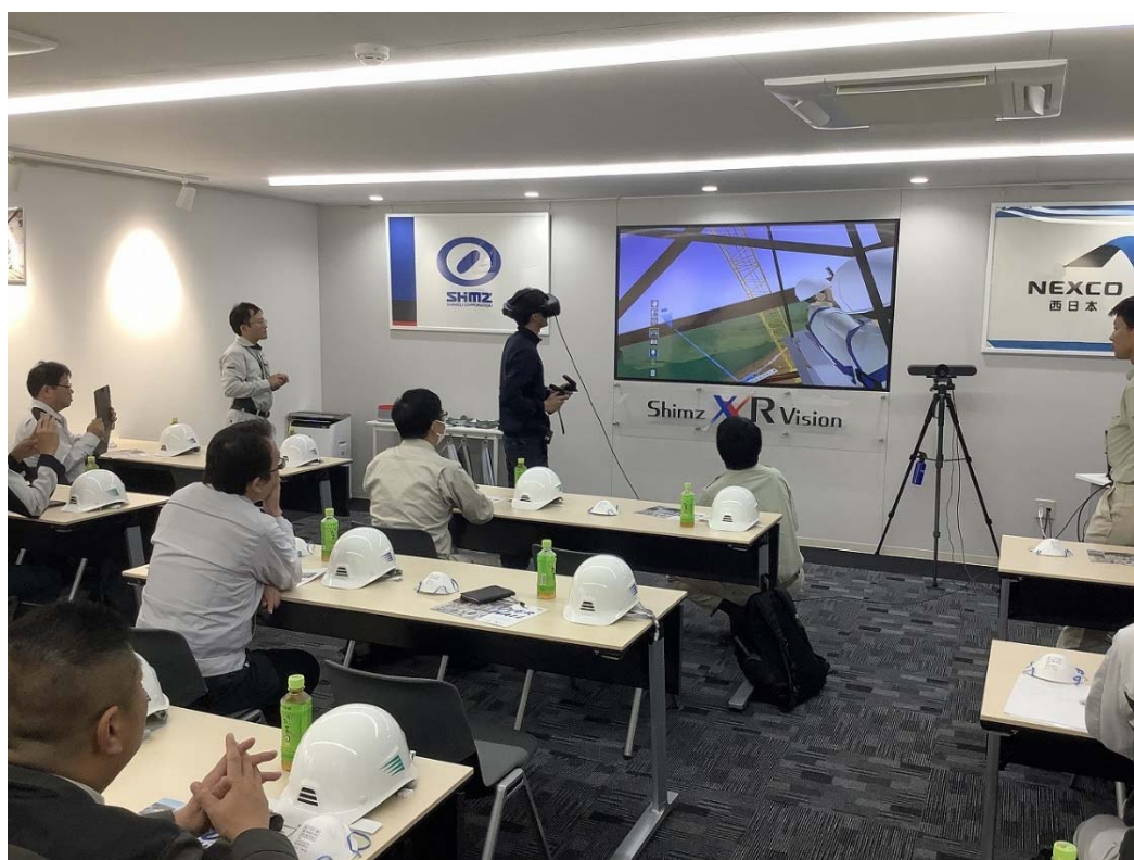
参加者による VR 体験